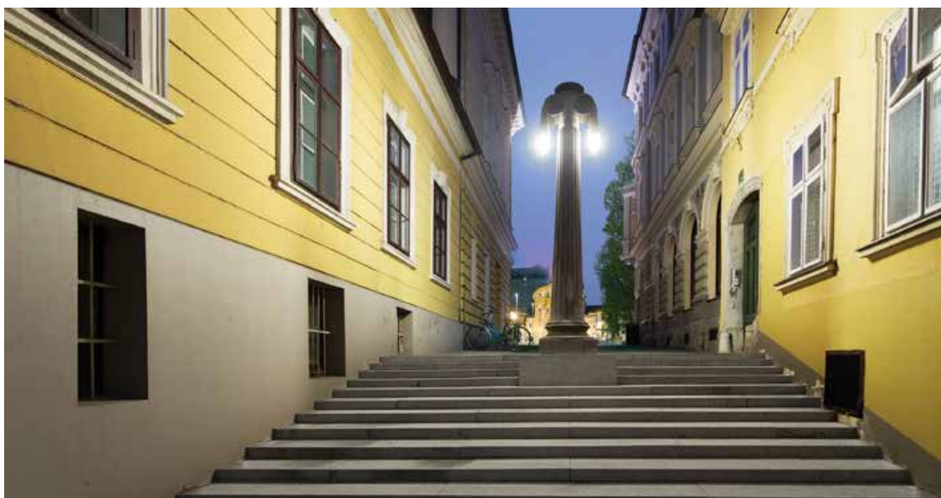
Gledališka stolba ponoči.