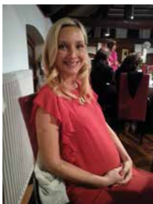
Leto 2016 za Barbaro ni bilo posebno le zaradi projekta ZPE :).

Prva misel je otvoritvena slovesnost v Stožicah: bučen aplavz polne dvorane in županov dvignjen palec ob koncu. To je bil trenutek, ko so bile poplačane vse neprespane ure. A najbolj sem ponosna na to, da smo prebudili kolektivni duh, ki je zadihal zeleno.