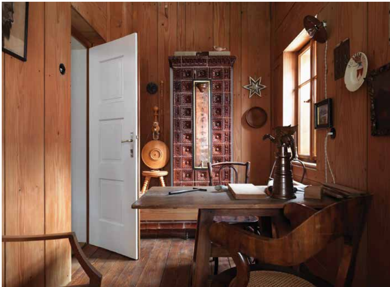
Mala sprejemnica v Plečnikovi hiši, kjer je arhitekt gostil le svoje najbližje prijatelje.