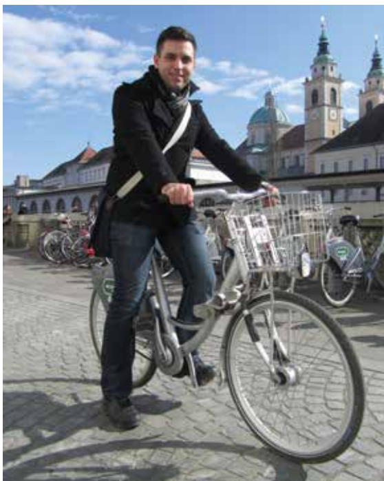
Moj najljubši kotiček v Ljubljani: uživanje ob kavici na sončku v središču mesta ali pa ŠRC Stožice, predvsem takrat, ko rezultat kaže v prid Olimpiji.